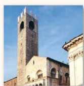
Palazzo Broletto Piazza Paolo VI