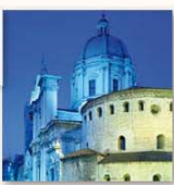
Duomo Vecchio e Duomo Nuovo Piazza Paolo VI