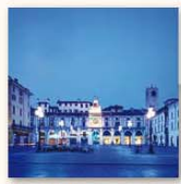
Piazza della Loggia