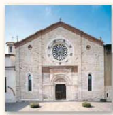
San Francesco d'Assisi Via San Francesco