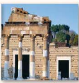
Tempio Capitolino Via Musei, 57/a