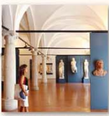
Museo di Santa Giulia Via Musei, 81/b