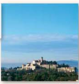
Castello Via del Castello