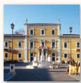
Piazza del Mercato