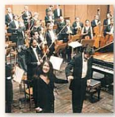
Festival Pianistico Internazionale di Brescia e Bergamo

Prenotazioni alberghiere, itinerari turistici ed escursioni in città e provincia: BRESCIA INCOMING POOL Tel./Fax 030.40061 www.bresciaincomingpool.it