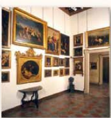
Pinacoteca Tasio Martinengo Via Martinengo da Barco, 1